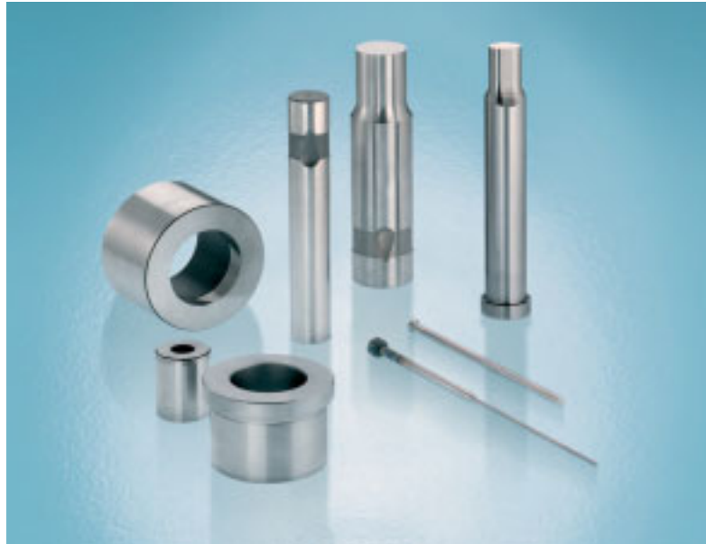
Schneidstempel/-buchsen nach DIN & ISO – auch in Hartmetall –