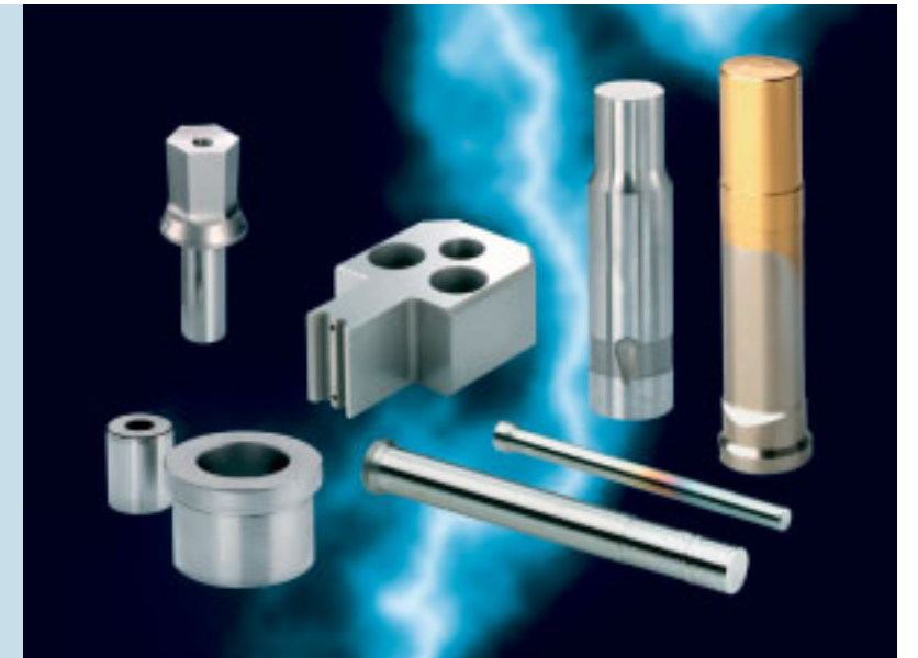
Perfektion braucht Präzision