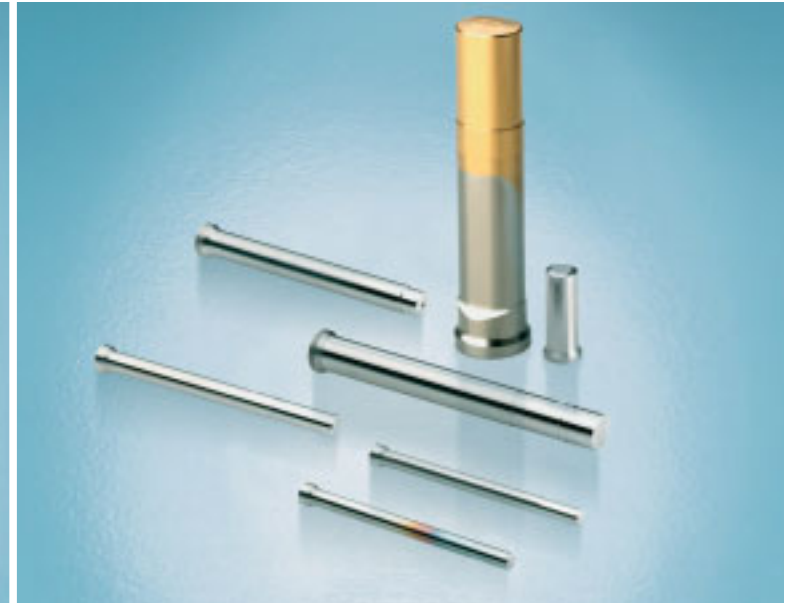
Stempel für Massivumformung